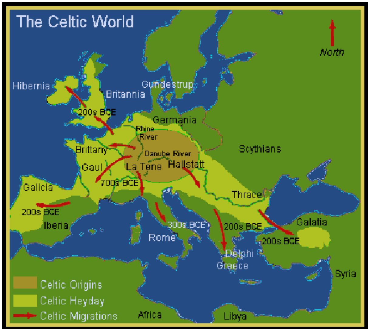
Verspreiding van de Kelten over Europa vanuit hun kerngebied in Centraal Europa

Het gebied waarin de Kelten leefden was constant onderhevig aan veranderende stammen en naties. Op het hoogtepunt van de Keltische cultuur in de La Tène periode reikte hun gebied van de Britse eilanden tot aan Turkije. Niet een centraal gezag, maar de gemeenschappelijke cultuur bond dit volk. Zij hadden hun eigen, individuele identiteit maar deelden ook veel cultuurelementen zoals taal, religie en levensstijl. Griekse schrijvers gaven de Kelten als eerst hun naam. Zij noemden ze Keltoi, wat zoiets als barbaar betekent. Bij de Romeinen stond dit volk op het vasteland bekend als Galli en als Britanni op de eilanden van Brittannië.