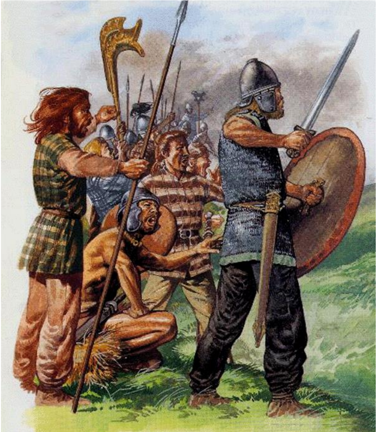
Voorbeeld van Keltische wapenrusting tijdens een veldslag

De basisuitrusting van een Keltische krijger bestond uit een set van één tot vier speren. Eén was de 1,8 meter lange vechtsspeer die soms een speerpunt van wel 50 cm had. De andere waren kleinere werpsperen met relatief kleine, korte speerpunten. Een soldaat had ook een groot houten schild, bedekt met leer en met een metalen schildknop, dat ongeveer 1,2 meter hoog en 0,5 meter breed was. Waarschijnlijk werd dit schild versierd met geverfde symbolen of metalen decoratie. Naast deze basisuitrusting droeg de Keltische strijder zijn gewone kleding, een broek, een shirt en een mantel. Alleen een Keltische edelman droeg waarschijnlijk een zwaard, de lengte van de kling varieerde van 0,8 tot 1 meter. De zwaarden van vroegere periodes hadden duidelijke zwaardpunten en waren hierdoor in staat om zowel te hakken en te slaan als te steken. Later werd de punt afgerond en kon het zwaard vrijwel alleen gebruikt worden om te hakken en te slaan. Soms was het zo, vooral in de