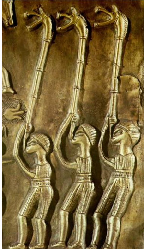
De carnyx, een blaasinstrument waarmee de Kelten hun vijanden schrik aan joegen

Om de vijanden voor een slag schrik aan te jagen, bliezen de Kelten op de carnyx. Dit was een lange, J- of S-vormige hoorn met een metalen mondstuk en een bel die de vorm had van de kop van een religieus belangrijk dier als het everzwijn. De carnyx zelf was waarschijnlijk van hout gemaakt en werd bij het blazen verticaal gehouden. De klank was, volgens de schrijver Diodorus, beangstigend en passend bij het tumult van de oorlog. Naast een psychologisch doel bij oorlogvoering had het instrument waarschijnlijk ook een religieuze functie.