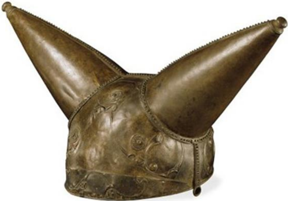
Typisch voorbeeld van een Keltische helm

Toen de Griek Ephorus het bestaan van de Kelten vermeldde, waren ze al zo talrijk dat hij ze één van de vier barbaarse volkeren in de wereld noemde, de anderen waren de Libiërs in Afrika, de Perzen in het oosten en de Scythen, die ook in Oost-Europa leefden. De Kelten vormden tegen die tijd een grote groep stammen die leefden in een gebied dat van Schotland en Rusland tot het Mediterrane gebied reikte.