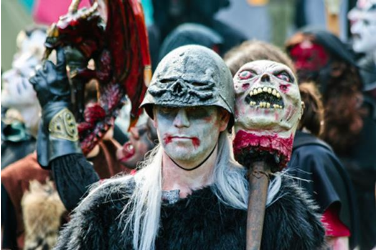
Reconstructie van een Keltische veldslag

De Kelten hebben vele gevechten gestreden, gewonnen en verloren. Soms waren dit kleine schermutselingen met slechts enkele honderden soldaten, maar er waren ook massale veldslagen in welke tien- tot honderdduizend mensen meevochten. In tegenstelling tot de Romeinen echter waren de Kelten waarschijnlijk niet gewend om te vechten in formaties en georganiseerde eenheden. De beschrijvingen die we hebben van oude bronnen, die natuurlijk meestal niet onbevooroordeeld waren, vertellen dat ze meestal in ongeorganiseerde groepen vochten. De oude Keltische legers vochten met hun vijand alsof ze hem zouden verslaan door hem met brute kracht te overweldigen, in plaats van met een uitgedachte tactiek. Deze instelling kwam waarschijnlijk deels door de Keltische mentaliteit waarin individuele dapperheid en heldendaden in hoger aanzien stonden dan overwinning door een dicht opeen gepakte formatie. En deze instelling heeft ook zeer vaak geholpen. De Kelten maakten veel gebruik van psychologische oorlogvoering. Voordat ze op hun vijand afstormden, maakten ze lawaai door hun wapens tegen hun schilden te slaan, te roepen en te zingen terwijl grote strijdhoorns, camyces en trommels weerklonken. Vervolgens lieten ze de afgeslagen hoofden van voorgaande vijanden zien als trofee. Wanneer de slag eenmaal losbarstte raakten de