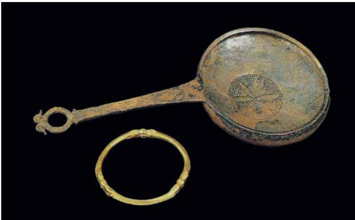
Typische grafvondsten in adellijke Keltische graven

De Kelten hadden geen kastenmaatschappij, alhoewel er wel verschillende standen in de samenleving waren. Sociale mobiliteit was echter mogelijk. Het hoogste aangeschreven stond de adel. Soms was de hoogste edelman een koning, deze was meestal koning over of stamhoofd van een stam, maar later kwamen naties die bestonden uit verschillende stammen onder een koning te staan. Koningschap werd gezien als goddelijk en de leider was degene die namens de goden sprak. De kroon was echter niet altijd erfelijk, want koningen konden een opvolger aanwijzen. De erfelijke titel bij de Picten was via de vrouwelijke lijn, hoewel de vorst zelf vaak wel mannelijk was. De monarchie was echter niet de enige Keltische regeringsvorm, waarbij de stamleider altijd werd uitgekozen door de stam. In Gallië was het bij sommige stammen voor de Romeinse verovering de gewoonte dat de edelen een magistraat, de Vagobret, kozen die de stam regeerde. De werkelijke macht lag echter vrijwel altijd bij de adel, zij bezaten het land en hun zonen en dochters werden de generaals en druïdes.