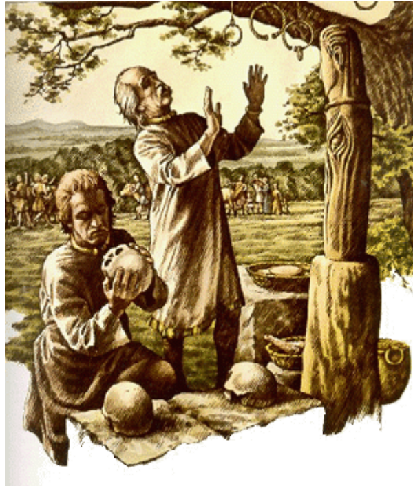
Voorstelling Keltische druiden

Er is zeer weinig bekend over de Keltische religie. De enige bronnen over het geloof zijn afkomstig van Romeinen en Grieken, die de Kelten als niet meer dan dieren zagen, of van Welshe en Ierse monniken, die de oude religie vanuit het perspectief van het christendom bekeken. Zeker is echter het volgende.