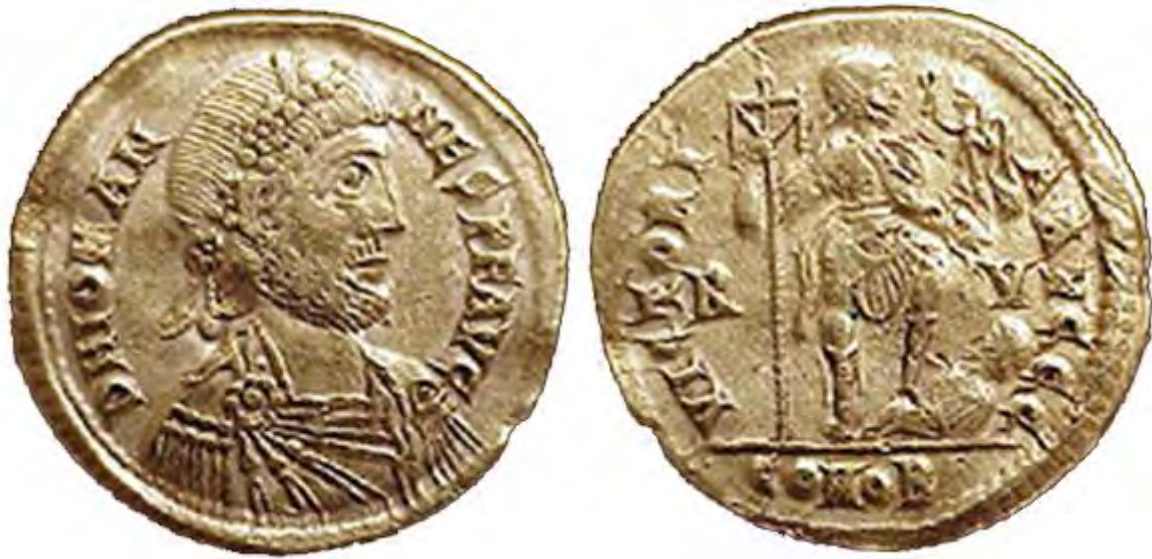
Solidus (munt) van Keizer Johannes.

Johannes (? - juli 425) was West-Romeins keizer van eind 423 tot de zomer van 425. Hij werd niet erkend door de Oost-Romeinse keizer Theodosius II, en wordt daarom usurpator genoemd.