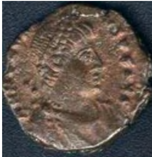
Munt met afbeelding van Keizer Honorius.

Flavius Honorius (384 - 423) was een Romeins keizer van 395 tot 423, en de jongere zoon van Theodosius I en de broer van Arcadius, die keizer van het Oosten werd. Na de dood van Theodosius in 395 was het Romeinse rijk definitief in tweeën gesplitst.