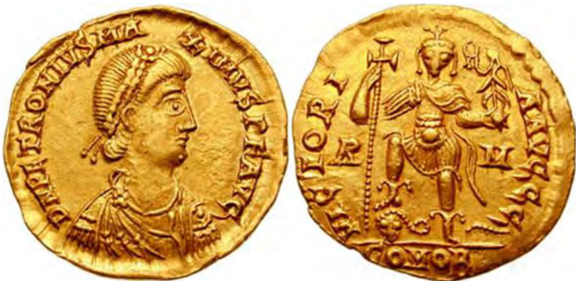
Solidus (munt) van Keizer Petronius Maximus.

Petronius Maximus (ca. 397 - 22 mei 455) was West-Romeins keizer van 17 maart tot 22 mei 455.