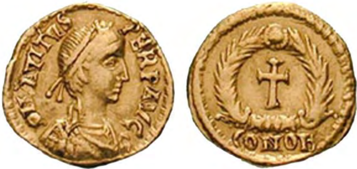
Keizer Avitus op een tremissis (munt).

Marcus Maecilius Flavius Eparchius Avitus (ca. 395 - 457) was West-Romeins keizer van 9 juli 455 tot 17 oktober 456.