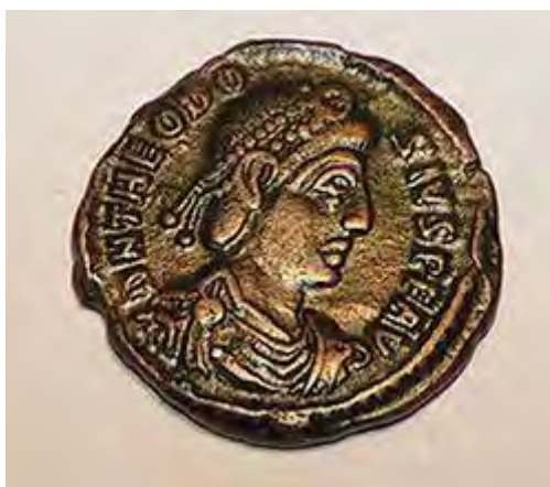
munt met afbeelding van Romeins Keizer Theodosius I.