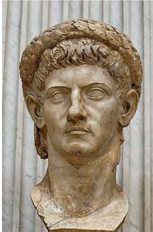
buste van Claudius als Jupiter. Marmmer, Romeins kunstwerk, ca. 50 n. C van Lanuvium, Italië.

Claudius was de vierde princeps die Rome kende. Hij volgde de vermoorde Caligula op, van wie hij de oom was. Hij werd door de praetoriaanse garde uitgeroepen tot princeps en kwam aldus op ongeveer vijftigjarige leeftijd nog aan het hoofd van het Imperium Romanum te staan. Onder Claudius' regering zouden - net zoals onder die van Tiberius - verscheidene (administratieve) innovaties het licht zien. Bovendien wist Claudius het rijk uit te breiden met de verovering van Britannia.