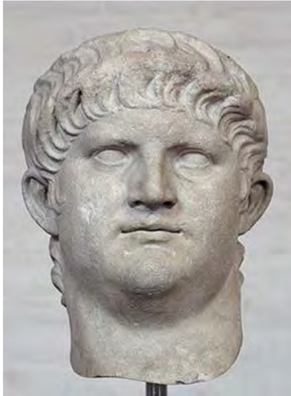
Nero in de glyptotheek van München

Nero was de vijfde en laatste princeps van de Julisch-Claudische dynastie. Door zijn autocratisch optreden en excentrieke gedrag maakte hij vijanden onder de Senatoren, wat de Senaat er uiteindelijk toe zou brengen Nero uit te roepen als hostis (staatsvijand). Deze zou na Rome te hebben onvlucht zelfmoord hebben gepleegd. Hiermee kwam een einde aan de Julisch-Claudische dynastie en begon een periode van burgeroorlog die de geschiedenis zou ingaan als het vierkeizerjaar (69). Uiteindelijk zou de Flavische dynastie als triomfator uit de strijd komen en de teugels van Rome in handen nemen.