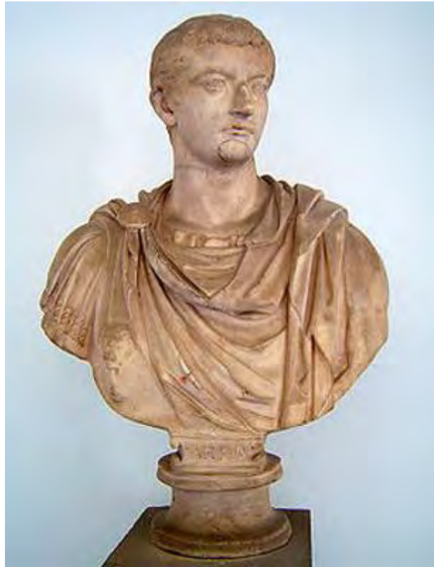
buste van Tiberius (Museo Archeologico Regionale, Palermo)

Tiberius was de tweede princeps van Rome, als opvolger van Augustus. Ondanks zijn schitterende (militaire) carrière voordat hij princeps werd, zou hij de geschiedenis ingaan als een somber en wantrouwig heerser. Hij werd daarom ook wel tristissimus hominum ("de triestigste aller mensen") genoemd. Hij zou een aantal hervormingen doorvoeren die het principaat nog steviger verankerde in de Romeinse samenleving en liet aan het eind van zijn regering een goedgevulde schatkist achter.