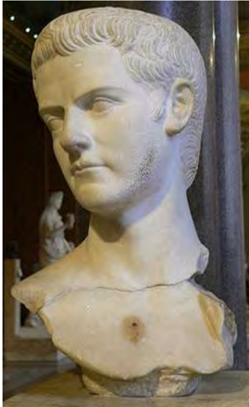
buste van Gaius Caligula met een baard als teken van rouw om zijn zus Lulia Drusilla (39-41 n. C., Louvre, Ma 1234).

Gaius Caesar Augustus Germanicus (Antium, 31 augustus 12 - Rome, 24 januari 41), postuum bekend als Caligula, was van 37 tot 41 princeps van Rome. Caligula's jeugd was getekend door de intriges van de eierzuchtige Selanus. Na een hoopvol begin van zijn regering, begon hij zich na een periode van persoonlijke tegenslag meer en meer te gedragen als autocratisch heerser, waarbij hij zijn bevoegdheden onder meer aanwendde om in hoogverraadprocessen talrijke senatoren naar willekeur ter dood te veroordelen. Een geslaagde moordaanslag van de Praetoriaanse garde maakte een einde aan zijn schrikbewind, dat gevolgd werd door een damnatio memoriae door de senaat.