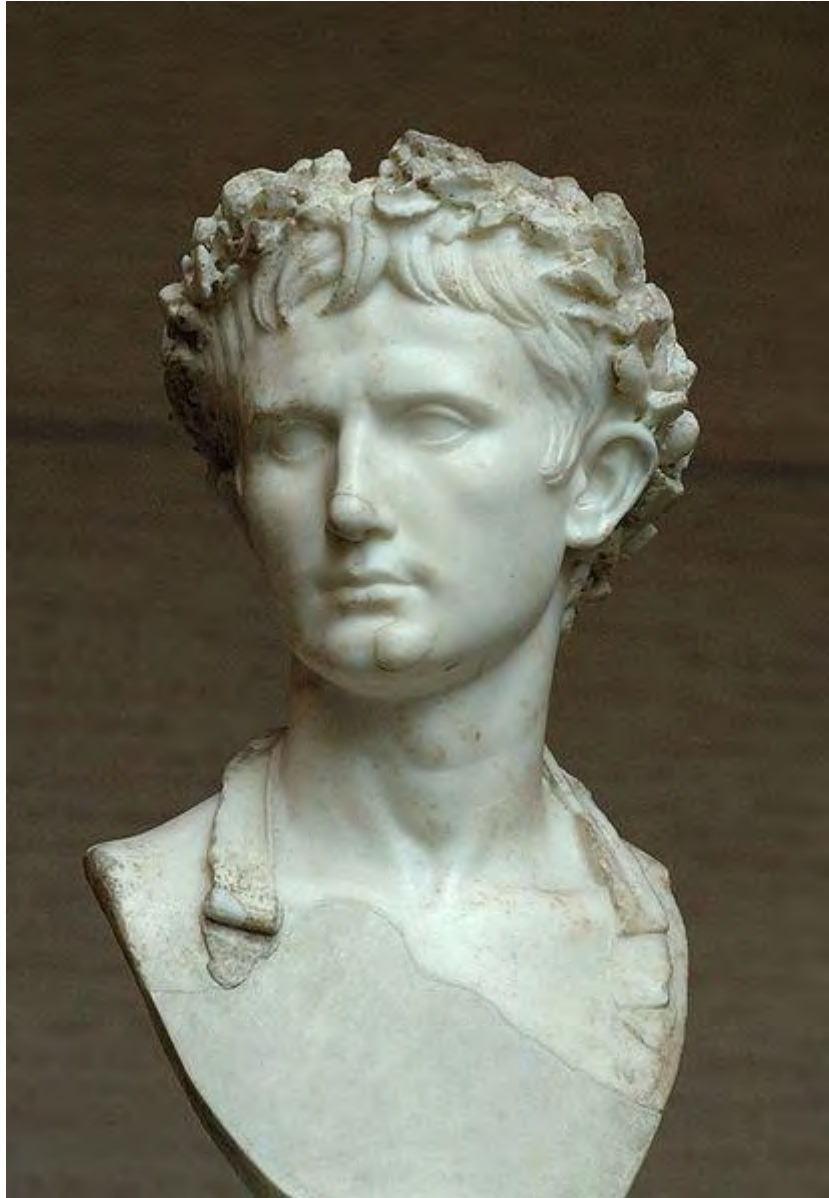
Postuum portret van Imperator Caesar Augustus met corona civica (zogenaamde "Augustus Bevilacqua"-buste, 45-50, Glyptothek München).

Gaius Octavianus werd geboren in Rome op 23 september 60 v. C. Hij was afkomstig uit een plebejisch geslacht en was Caesars kleinneef. Reeds zeer vroeg hield Caesar zich bezig met de opvoeding en in 45 v. C adopteerde hij hem bij testament. Na de wettelijke bekrachtiging heette hij officieel Gaius Julius Caesar Octavianus. Men roemde hem om zijn fysieke schoonheid maar hij had een zwakke gezondheid. Ondanks alle mogelijke voorzorgen had hij zijn hele leven lang