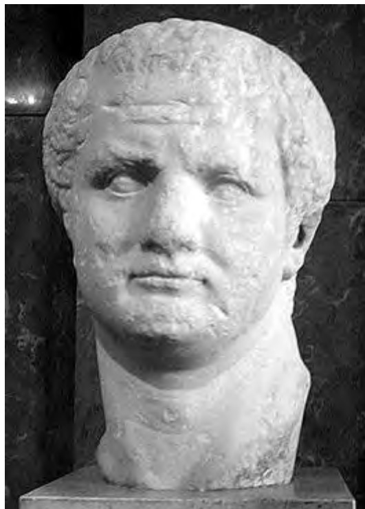
Titus - buste in het Louvre (Ma 3562), Parijs.

Titus Flavius Vespasianus (30 december 39 - 13 september 81), gewoonlijk alleen Titus genoemd, was keizer van Rome van 79 tot 81 en een telg van het geslacht der Flavii.