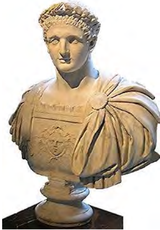
buste van Romeins keizer Domitianus. Antiek hoofd, lichaam toegevoegd in de 18e eeuw. Museum het Louvre (Mo 1264), Parijs. Daarvoor deel van de Albani Collectie in Rome.

Titus Flavius Domitianus, Romeins keizer (81 - 96), was de zoon van Vespasianus en de broer van Titus.