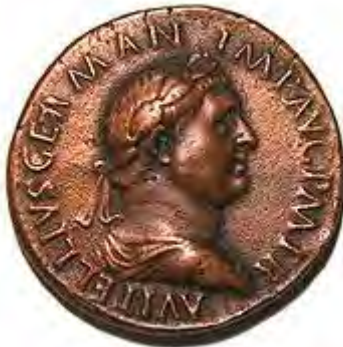
Vitellius (18-07-69 - 22-12-69)

Het Vierkeizerjaar, ook wel Driekeizerjaar genoemd, is een bijzonder turbulent jaar geweest waarin veel Romeinse legioenen zijn betrokken en vier keizers elkaar in korte tijd opvolgen. Deze burgeroorlogen beginnen in maart van het jaar 68 met de opstand van Vindex en eindigen met het uitroepen van Vespasianus tot keizer op 20 december 69.