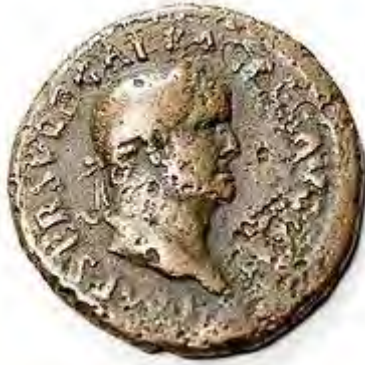
Galba (10-06-68 - 15-01-69)