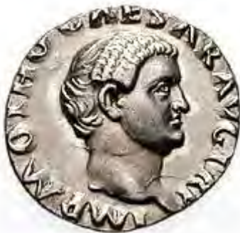
Otho (15-01-69 - 17-04-69)