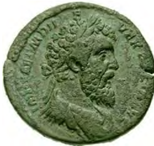
Munt met afbeelding van Keizer Didius Julianus.

Marcus Severus Didius Julianus (133-193) was keizer van Rome van 28 maart tot 2 juni 193. Hij kwam aan de macht door de troon te kopen. Dit betekende het begin van een burgeroorlog die ongeveer vier jaar zou duren. Hij werd afgezet en terechtgesteld door zijn opvolger, Septimius Severus.