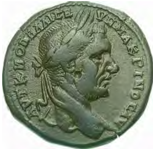
Portret van keizer Macrinus op een bronzen munt uit Moesia Inferior met opschrift: AVT K M O P E P I CEVH MAKPINOC AV.

Marcus Opellius Macrinus was een Romeinse keizer van 11 april 217, na de moord op zijn voorganger Caracalla bij Carrhae, tot 8 juni 218 toen hij mede door acties van Caracalla's familie in Syrië verslagen en gedood werd door de troepen van Elagabalus.