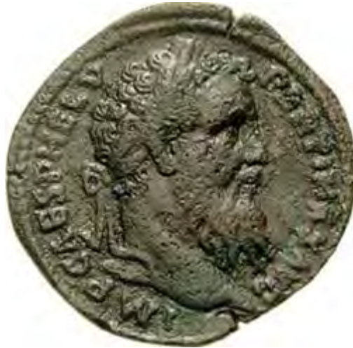
Munt met afbeelding van Keizer Pertinax.

Het kwam tot een treffen tussen de legioenen van Severus die naar de slag bij Lugdunum waren opgetrokken. Daar werden Albinus' troepen verslagen in een van de grootste veldslagen uit de Romeinse geschiedenis. Albinus vluchtte en pleegde zelfmoord.