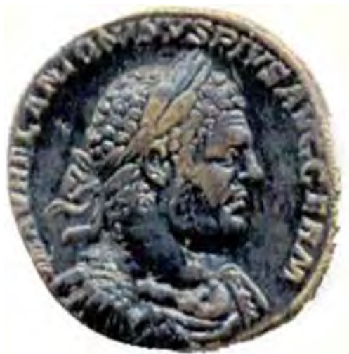
portret van de Romeinse Keizer Caracalla op een sestertius.