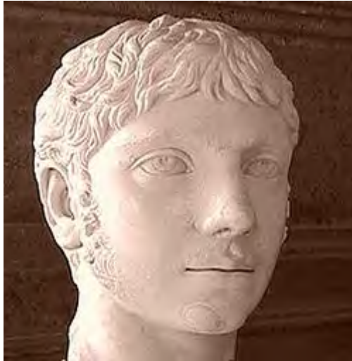
Capitolijns Museum, buste van Elagabalus als jongeman.

Marcus Aurelius Antoninus algemeen bekend bij zijn bijnaam "Elagabalus" of "Heliogabalus", was een Romeinse keizer van 218-222. Bij zijn geboorte, rond het jaar 203 heette hij Varius Avitus Bassianus. Zijn moeder, Julia Soaemias, was een nichtje van de roemruchte moeder van Caracalla, Julia Domna. Hij groeide echter op in Emesa in Syrië.